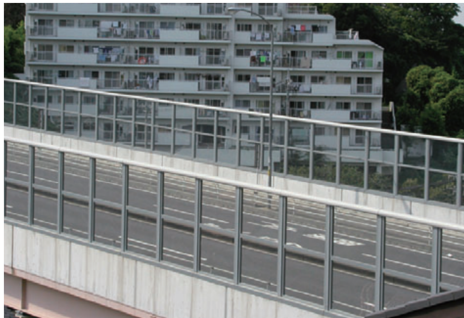
道路用ポリカ透光板

真空ガラス 複層ガラス 学校用ガラス 防火ガラス 防犯ガラス 強化・倍強度 合わせガラス 特殊機能ガラス 高透過ガラス 熱吸・熱線反射 板ガラス 装飾ガラス 鏡・コーティングガラス 板ガラス応用製品及び施工法 音響・防音・シールド工事 設計・施工・使用上のご注意 板ガラスの光学的性能・熱的性能 製品一覧