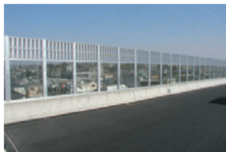
道路用ガラス透光板