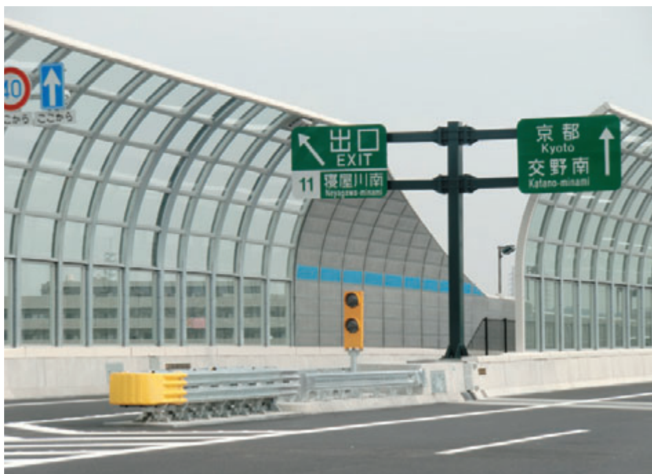
道路用ガラス透光板