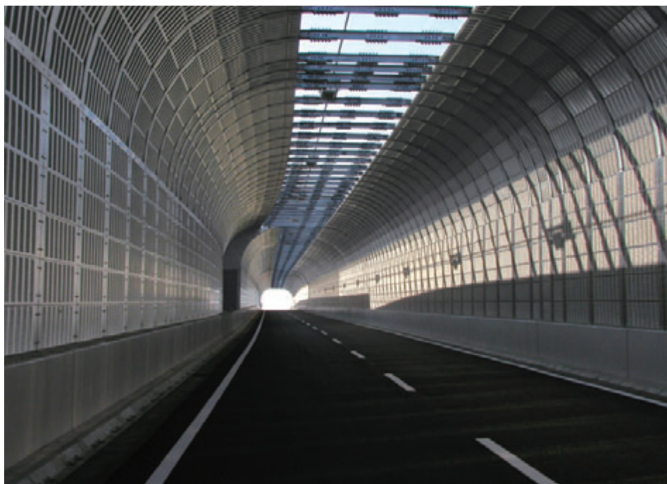
都市型高速道路用防音パネル

交通網の発達にともなって発生する騒音は、大きな社会問題となっています。近年、これらの騒音公害対策として防音壁が設置されていますが、弊社では、この騒音問題に対して長年防音パネルの研究・開発に取り組み、各種の製品でニーズに応えています。