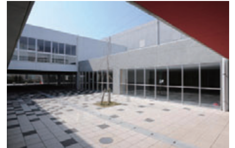
●横浜市立あかね台中学校（神奈川） 設計：みかんぐみ 施工：小俣・六国・日成建設共同企業体

※開口部の設計にあたってはガラス建材総合カタログ「技術資料編」の7-4-5.改訂版ガラスを用いた開口部の安全設計指針をご参照ください。