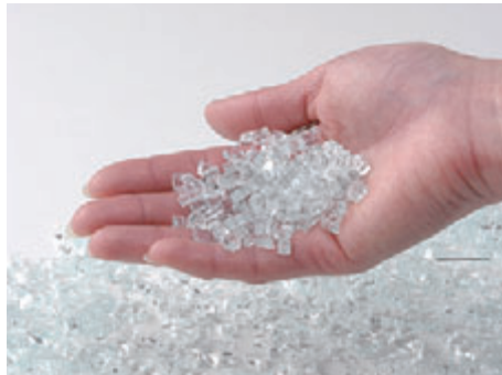
ホームタフライト